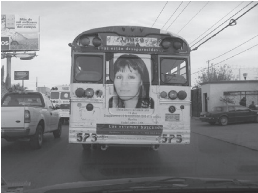
Campaña para localizar a las niñas y mujeres desaparecidas en Ciudad Juárez

de violencia que se deben atender, como Guadalupe y Calvo, Creel, el Valle de Juárez. En este sentido, toman fuerza las palabras dirigidas por Human Rights Watch a Enrique Peña Nieto, nuevo presidente de México: "Abordar los abusos cometidos durante el mandato de su predecesor e impedir que se reiteren en el futuro, requerirá de atención inmediata en los niveles más altos de su administración" (HRW 2012). Los líderes políticos están obligados a resignificar y resimbolizar esos cuerpos mutilados, incinerados, torturados y colgados en los puentes y mallas ciclónicas de nuestra ciudad, de nuestro país. Esto equivale a saber que son parte de la "insignificancia política de las grandes mayorías" (Cussiánovich 2005: 17) y que no fueron necesarios para definir y orientar un futuro de relaciones de respeto, de justicia y de la vida de la cual fueron despojados en el tiradero nacional de muertos en una estrategia de guerreros y caballeros ●