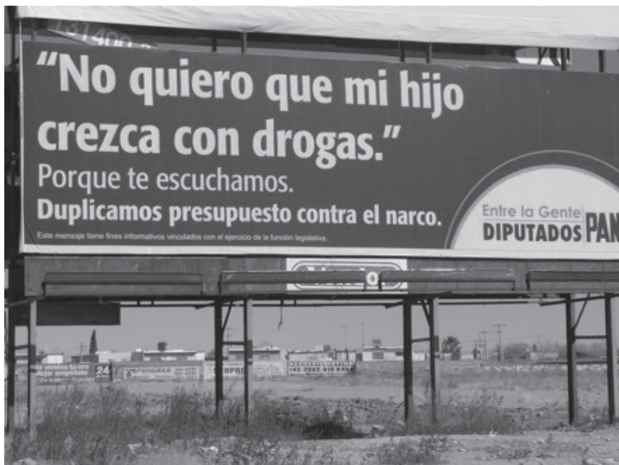
La estrategia caballerosa en una calle de Ciudad Juárez