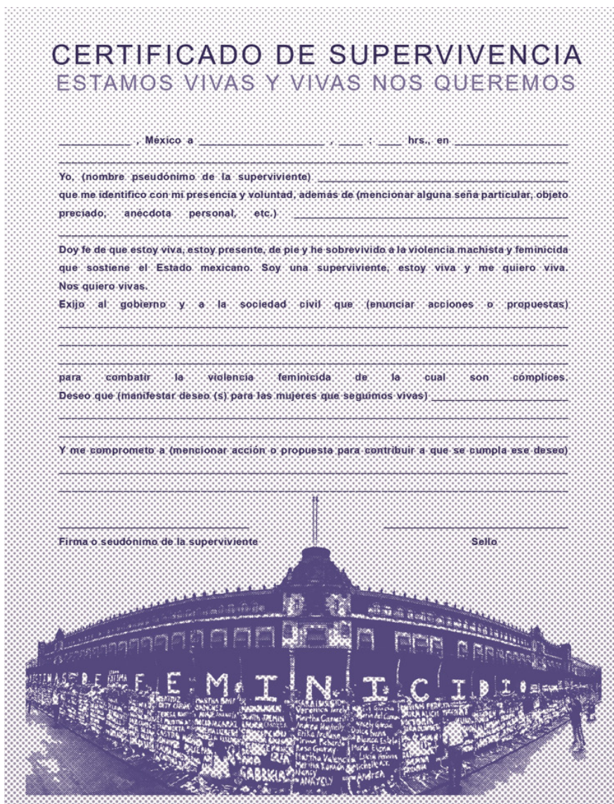
Figura 1. Certificado de supervivencia ESTAMOS VIVAS Y VIVAS NOS QUEREMOS

EL POTENCIAL CRÍTICO DE UNA ACCIÓN ARTÍSTICA, COLECTIVA Y CALLEJERA: LA EXPERIENCIA DE MÁS DE DOSCIENTAS MUJERES FRENTE AL FEMINICIDIO