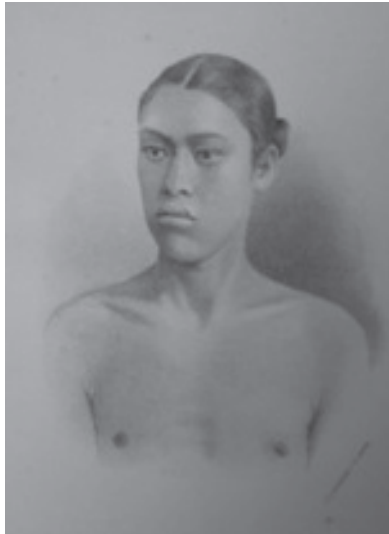
FIGURA 1. "Hay un momento en el que el ser humano no es hombre ni es mujer". "Guadalupe Vargas" en La Gaceta Médica de México , 1980.